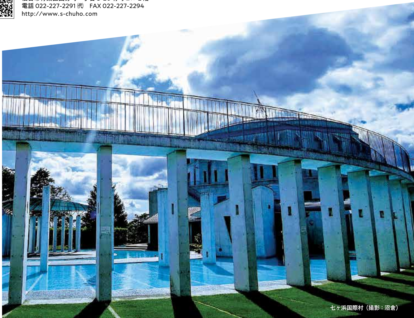
七ヶ浜国際村